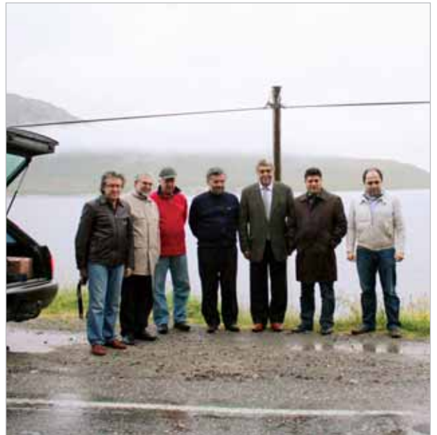
Yağmur ve sisli bir gecede/günde saat 00.35'de Tromvik sahili