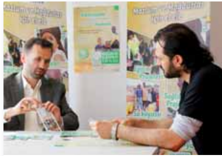
“Kur’an nerede namazdan bahsetse arkasından infak ibarelerini görürüz.”

Evvla isimlendirmeyi neden Gıda Paketleri olarak isimlendirdiğimizle başlayacak olursak; takdir edersiniz ki bu işlerin organizasyonu çok da dışardan görüldüğü gibi kolay olmuyor.