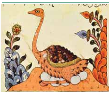
Zeichnung eines Straußes im bekannten „Buch der Tiere“ des Dschâhiz

Schon allein das weite Spektrum seiner Werke verdeutlicht, wieso Dschâhiz einen so großen Bekanntheitsgrad in der Vergangenheit als auch heute noch innehat. Dschâhiz ist wohl einer der herausragendsten Vertreter der arabisch-islamischen Kultur des 9. Jahrhunderts. Eine vielseitige Persönlichkeit, die sich nicht nur mit klassisch „religiösen“, sondern auch mit einer Reihe von anderen Inhalten auseinandergesetzt hat. Er lebte in einer Zeit, in der die wissenschaftlichen Bestrebungen auf ihrem Höhepunkt angelangt waren. Diese „Blütezeit“ trug auch zum großen Erfolg seiner Werke bei. ■