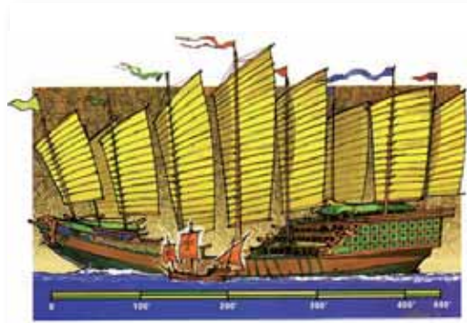
Zheng He'nin gemisinin Kolombus'un gemisiyle karşılaştırılması