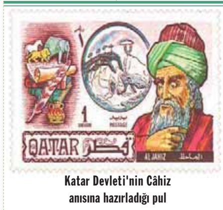
Katar Devleti'nin Cāhiz anısına hazırladığı pul

Halife Me'mun, Câhiz'in farklı eserlerinden etkilendi. Bu nedenle 815 yılında Bağdat'a çağırdı. Bu tarihten itibaren Câhiz çoğunlukla Bağdat ve Samara'da halifenin ve devlet büküklerinin yakınında bulunarak, çeşitli eserler yazıp onlara takdim etmiş, karşılığında bol miktarda da maddi destek almıştır. Câhiz 861 yılında Ha-