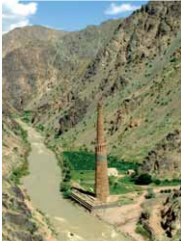
Gürüler dönemine ait, Meryem Süresi işlemeli Cem Minaresi