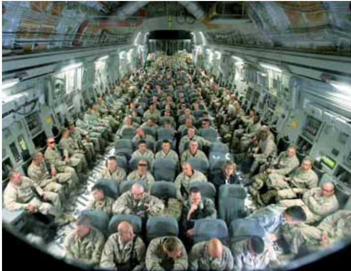
Afganistan'a giden Amerikan askerleri