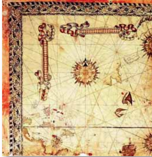
Piri Reis'in dünya haritası ve Pusula Güllü

Bu deniz yolculuklarının en etkileyici yanı çok büyük ve son derece iyi organize edilmiş olmalarıdır. Zheng He, en büyük gemilerinden altmış ikisinin 136,85 metre uzunluğunda ve 56,08 metre genişliğinde olduğunu yazar. Zheng He, ayrıca her gemide; aralarında denizci, kâtip, tercüman, asker, zanaatkar, tıpçı ve meteoroloji uzmanlarının da bulunduğu dört yüz elli-beş yüz kişinin olduğunu da yazar. Dör-