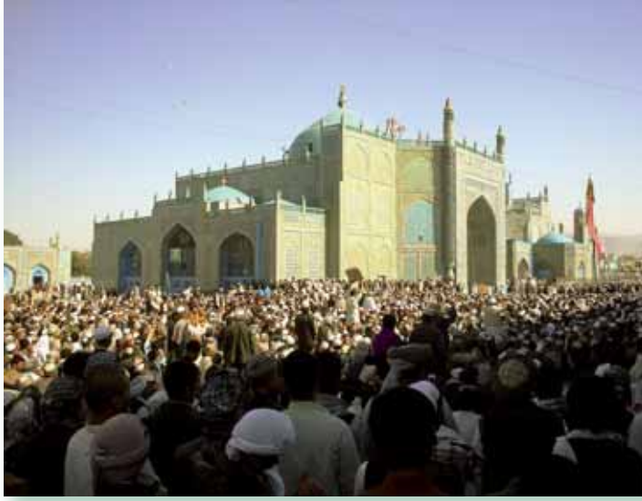
Mezar-ı Şerif'te Hz. Ali türbesi olarak bilinen Ravza-i Şerif Camii

Sovyet işgali, iç savaş ve 2001 yılındaki ABD işgaliyle birlikte ülkede baş gösteren savaş ortamı ülkede kendini hemen hissettirmektedir. Yıkılmış evler, parçalanmış tanklar görülür sokaklarda. Ülkeye yönelik bütün bu saldırı ve işgallerde Afgan halkı büyük maddi ve manevi zararlara maruz kalmış, kitlesel