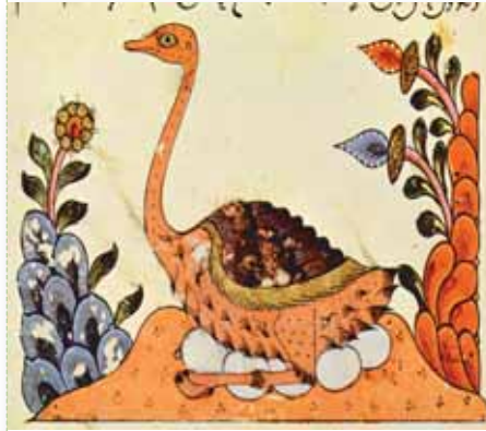
Cahiz'in "Hayvanlar Ansiklopedisi" eserinden bir Deve Kuşu figürü