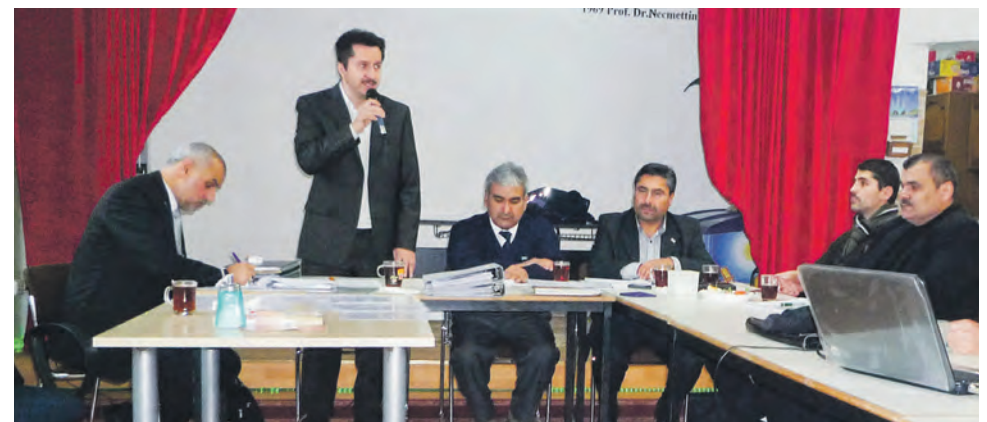
Bölge temsilcileri teftiş yapıyor