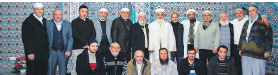
Gelsenkirchen Tuğra Camiindeki irşad programına katılan cemaat

Cemaat ve yöneticilerin büyük beğeni ile feyiz aldıkları bu ve bu gibi irşad programlarının belirli aralıklarla devamı talep edildi.