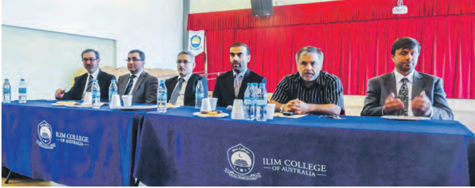
Ilım Koleji'ni ziyarette okul ile ilgili bilgiler verildi

Genel Merkez yetkililerinin ziyaretinden büyük memnuniyet duyduklarını belirten Avustralya bölge yetkilileri bu tür görüşmelerin kendilerini motive ettiğini söylediler.