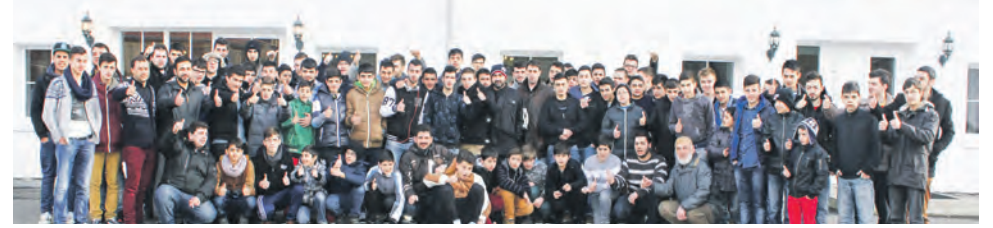
Eğitim seminerine 88 gencimiz katıldı.

Bölge Gençlik Teşkilatı Yatılı Eğitim Semineri Bad Wurzach Jugendherberge'de yapıldı.