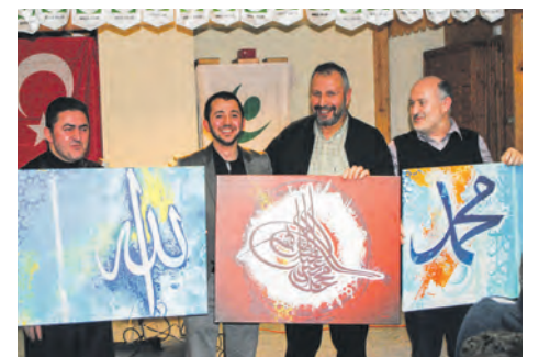
Programda açık artırma yapıldı

Programın ilerleyen saatlerinde farklı etkinlikler ve yarışmalar da yapılırken Hannover Gençlik Teşkilatının yetim projesi için açık artırmada bulunuldu. Açık artırmaya çıkarılan tablolardan elde edilen gelirler yetimler projesine aktarılacak. Program kapanış Kur'an-ı Kerim'i ile son buldu.