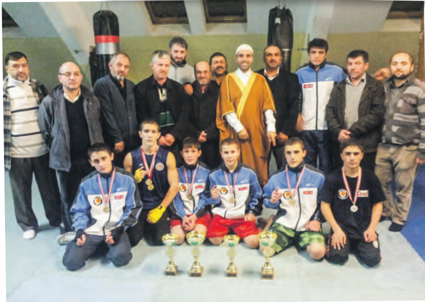
Gençlerimiz spor yarışmasında ödül aldı