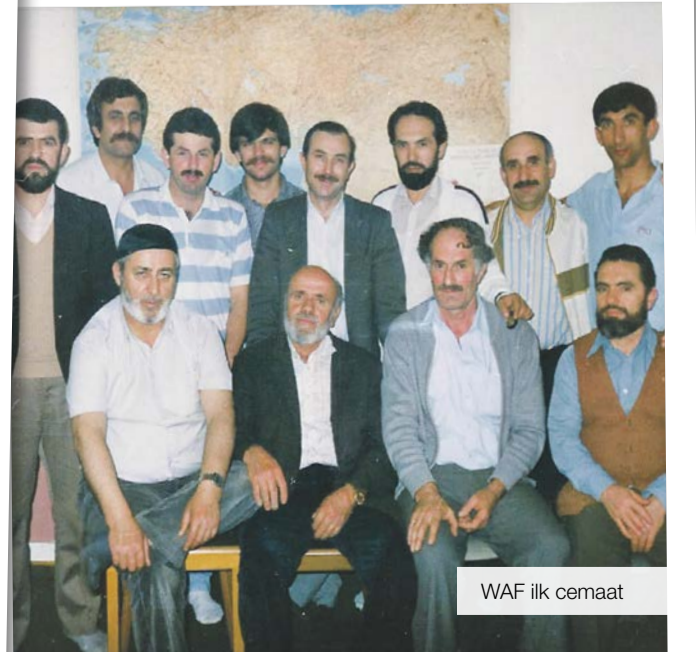
WAF ilk cemaat