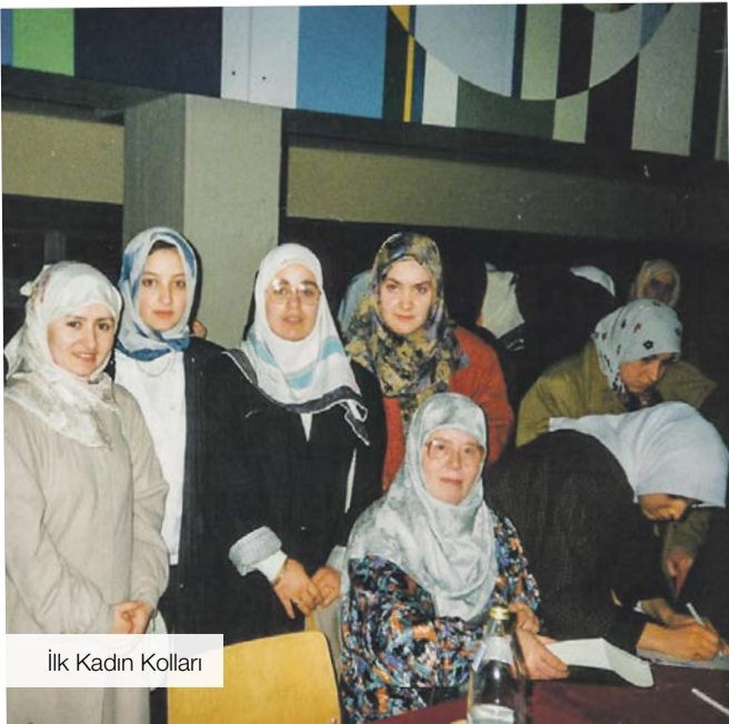
İlk Kadın Kolları

Birkaç binadan oluşan Hicret Camii, daha önce ayakkabı imalathanesi olarak kullanılırken, bina bünyesindeki alanlar caminin kuruluşundan itibaren tadilatından geçirilmiştir. Caminin sürekli tadilata duyduğu ihtiyaç cemaatin bir araya gelerek birliktelik bağlarını pekiştirmesi için de bir vesile olarak görülmekte, Allah rızası için hem vaktini, hem de maddi olanaklarını seferber eden cemaat bu inşaatlarla şehirde sayısı çok da fazla olmayan Müslümanlara ibadet ve sosyal faali-