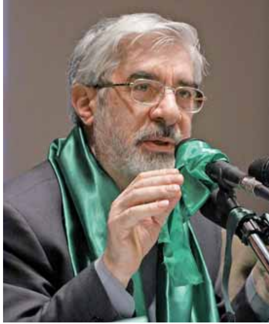
Muhalefet lideri Musevî

Batılı devletler İran devrimini ilk başlarda özgürlükleri yükseltecek ve Şah tarafından getirilmiş sınırlamaların kalkması olarak yorumlamıştı. Ayetullah Humeyni'nin beklenenden daha popüler olduğunun farkına varılmasından sonra batılı yaklaşım içselleştirici olmaktan ziyade dışlayıcı bir eğilim göstermiştir. İran devriminin ta başından beri batılı devletler üzerinde yarattığı şokun bir yan etkisi olarak, batılı devletler son otuz yıldır İran'da yaşanan en küçük bir rejim karşıtı kıpırdanmayı devrimin sonunun geldiği şeklinde yorumlamışlardır. Son seçimlerin batılı devletler nezdindeki yorum ve değerlendirmeleri bunun küçük bir yansıması olarak görülmez. Belki bu yaklaşımın en ilginç tarafı batılı devletler tarafından rejimi