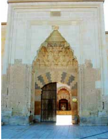
Anadolu’da Selçuklulardan kalma bir kervansaray

Damıtma, kaynama noktalarına göre sıvıları ayırma işlemi, Müslüman kimyacıların 8.yy’dan beri uyguladıkları bir yöntemdir, ilk ve en ünlü kullanımı gül suyu ve esans üretimindedir. Şarabın damıtılmasından saf alkol bulunmuştur. Cabir İbn Hayyan eserinde alkolün damıtılması için soğutma yöntemlerini açıklamıştır. Bu damıtılmış alkol, asit, ilaç ve parfüm üretiminde ve yazı yazma gibi işlemlerde kullanılmıştır. Cabir damıtmada “imbik”i kullanan ilk kimyacıdır ve imbik hala laboratuvar-