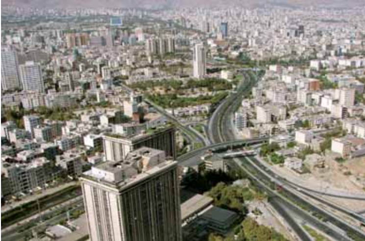
11 milyona yaklaşan nüfusuyla başkent Tahran dev bir metropol

Tahran, 11 milyona yaklaşan nüfusu ile İran'ın en büyük şehri ve başkenti. Aynı zamanda ülke nüfusunun %15'ine ev sahipliği yapıyor. Meşhed, İran'ın ikinci büyük şehri ve İmam Rıza Türbesi bu şehirde olduğu için dünyadaki en kutsal Şii şehirlerinden biri. 2,8 milyonluk nüfusu ile turizmin merkezi olan şehre senede ortalama 15 ile 20 milyon kişi gelir ve İmam Rıza'nın türbesini ziyaret eder. Nüfusu 2 milyona yaklaşan İsfahan İran'daki diğer büyük şehirlerden biridir ve İsfahan bölgesinin başkentidir. İran'ın diğer büyük şehirleri Kerec, Tebriz, Şiraz, Ahvaz, Abâdân, Hemedan, Kirmanşâh, Kum ve Hurremşehir olarak sayılabilir. İran her biri atanmış bir vali tarafından yönetilen 30 bölgeye ayrılmıştır. Bölgeler "şehristan" denilen illere ve daha sonra da sırasıyla "bahş" ve "dehestan" ismindeki alt yönetim birimlerine bölünmüştür.