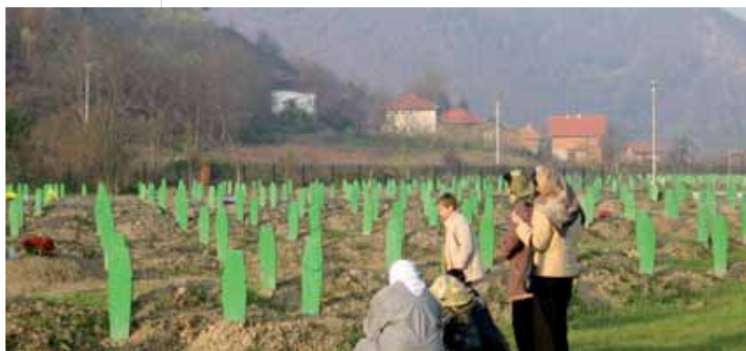
Massengräber in Srebrenica

Bosnien und Herzegowina hat Grausamkeiten erlebt, die man sich in einem kultivierten Europa nicht vorstellen