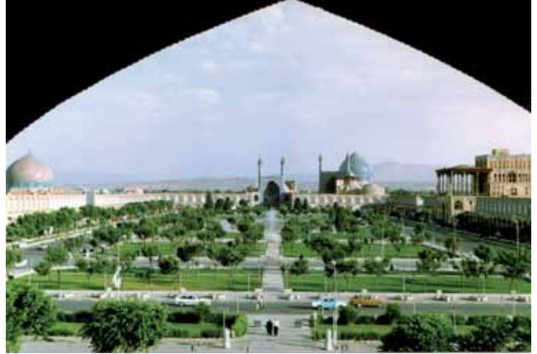
İsfahan'daki Nakş-ı Cihan Meydanı

İran kültürü, İslam öncesi ve İslami kültürün bir karışımıdır. İran'ın İslamlaşmasından sonra İslami töreler İran kültürüne girdi. Bunlardan en önemlisi Muharrem ayında yapılanlardır. Her yıl Aşure Gününde, Ermeniler ve Zer-