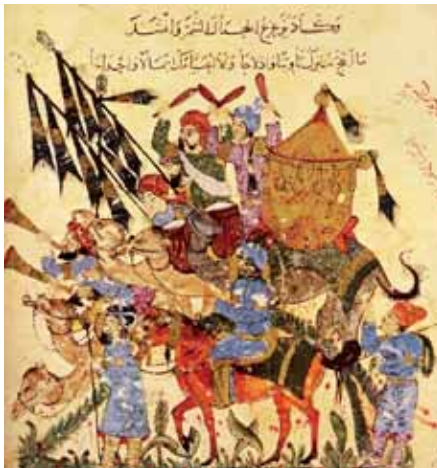
Müslümanların kervanlarını resmeden bir minyatür

İslam dünyasındaki bazı merkezler ticari alış-verişteki önemli konumlarından dolayı başarılı toplumlar ortaya çıkarmıştır. 10.yy gezgini İbn Havqal Tunus-Kayravan'ı ve Fas Sijilmasa'yı eserinde tarif etmiştir: "Mağrip'teki en büyük şehir Kayravan ticaretiyle, zenginliğiyle, marketlerinin güzelliğiyle diğer şehirlerin hepsine üstünlük sağlar. Mağrip'teki tüm şehirlerin geliri 700-800 milyon dinar arasındadır. Doğuya ihraç edilen mal-