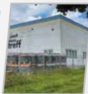
Souabe Biberach Mosquée et centre d'éducation