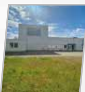
Hanovre Laatzén Mosquée et centre de mémorisation du Coran