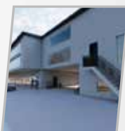
Württemberg Centre d'enseignement et d'apprentissage coranique d'Achern