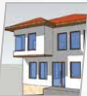
Les Balkans Maternelle de Sarajevo