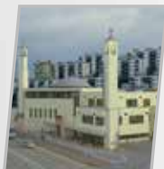
Suède Stockholm Complexe éducatif Skalholmen