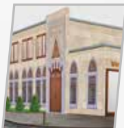
Berlin La mosquée Aziziya et son complexe