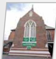
Angleterre Foyer d'irfân de Peckham