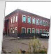
Hollande Sud Centre régional et centre d'éducation