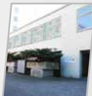
G. Bavyera Centre d'enseignement de Bergam Iaim