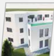
Linz Vorchdorf Mosquée et centre de mémorisation du Coran