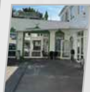
Köln Mosquée et centre d'enseignement d'Aachen