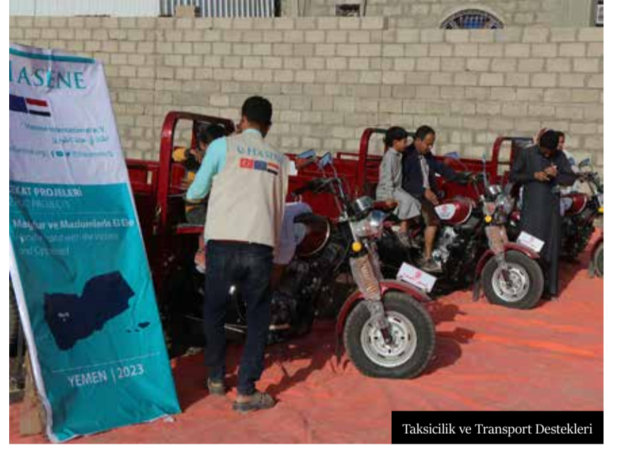
Taksicilik ve Transport Destekleri

bir fonda birleştiriliyor. Hasene Derneği'nin kurumsal bir disiplin ile yürüttüğü çalışmalar, dünyanın farklı bölgelerindeki mazlum, mağdur, muhacir ve mültecilere yardım eli uzatmanın yanı sıra Avrupa'da İslam'ın en güzel şekilde temsil edilmesi ve tanıtılması, eğitim gören öğrencilerin desteklenmesi, toplumun ihyası ve inşası doğrultusunda yapılan çalışmalar da bu fonda desteklenmektedir.