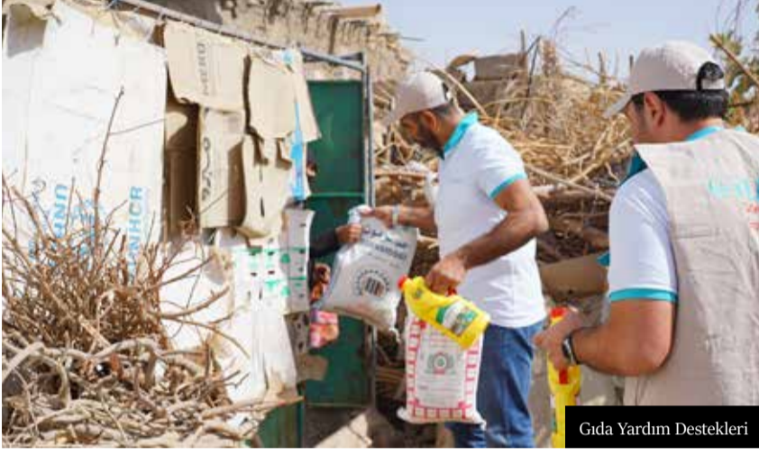
Gıda Yardım Destekleri

Hasene uluslararası insani yardım derneği “Zekât ve fitre ile kenetlenelim” sloganı ile 2023 yılı Zekât Fitre Kampanyası'nı başlattı.