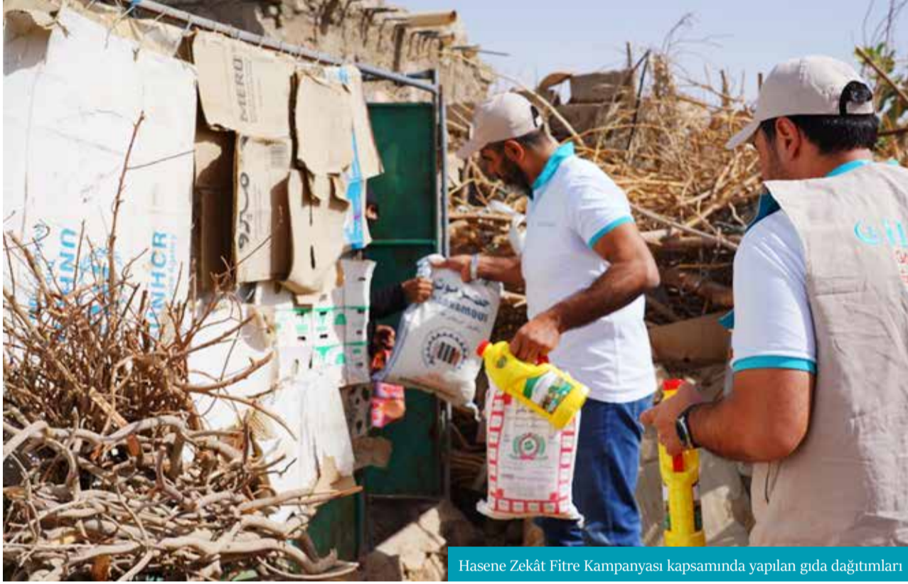
Hasene Zekât Fitre Kampanyası kapsamında yapılan gıda dağıtımları

Hasene bu yılki Zekât Fitre Kampanyası ile, dünyadaki pek çok projenin yanı sıra deprem bölgesinde özel "Mikro Hayat Projeleri" hayata geçirecek. Her şeyini kaybeden ailelere yardımcı olacak.